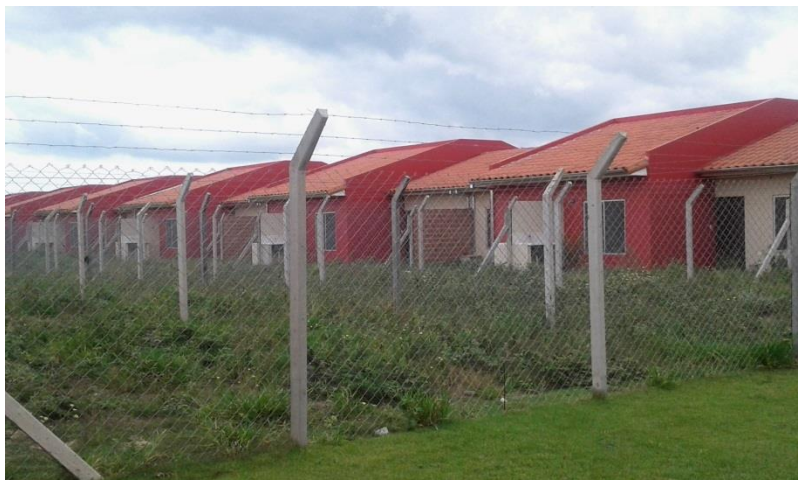
FOTO 6 - INSPECCIÓN 40 VIVIENDAS HABITAD BOLIVIA

habilitadas para los oficiales que prestan servicio en este departamento, a través de créditos individuales, porque son viviendas listas para ser habitadas.