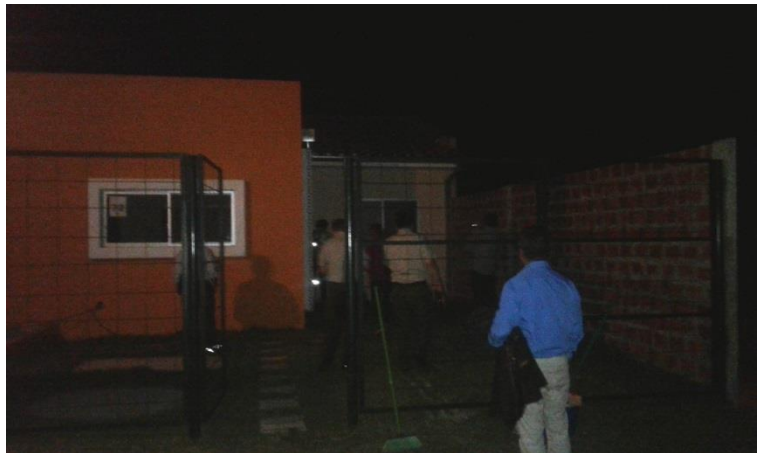
FOTO 5 - INSPECCIÓN PALMA VERDE

Sobre la visita e inspección a las 40 viviendas de HABITAD BOLIVIA, ubicadas en la Urbanización Canaán, mencionó, que existe la posibilidad de que sean