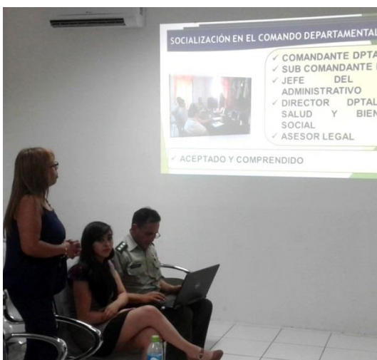
FOTO2 - EXPOSICIÓN DEPARTAMENTO SOCIAL

de apoyo institucional, situación del proyecto habitacional Palma Verde, estado de concesión de préstamos y refinanciamiento de créditos.