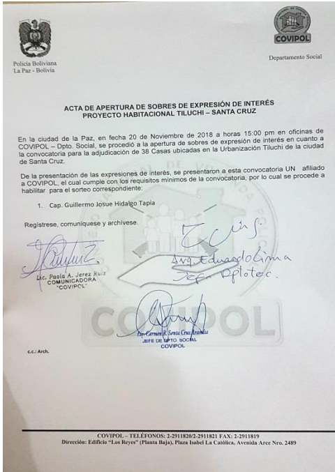
FOTO 3 ACTA

Los requisitos para acceder a la adjudicación eran, ser afiliado a la institución, carta de postulación, certificado de no propiedad, fotocopia de cédula de identidad, fotocopia de las tres últimas boletas de pago y no tener deuda pendiente con COVIPOL.