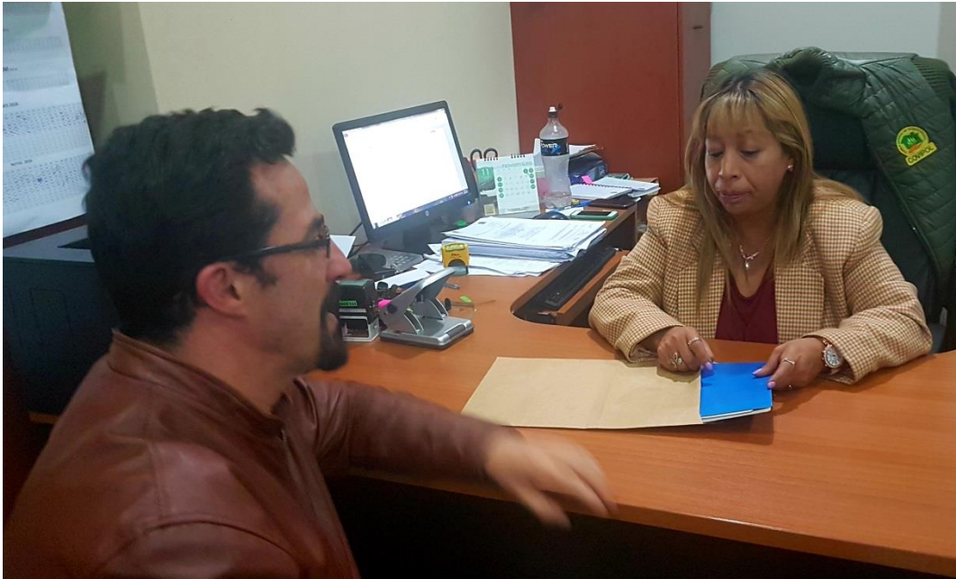
FOTO 1- APERTURA DE PROPUESTA DE INTERÉS

Continuando con los plazos establecidos en la Convocatoria para la Adjudicación de Vivienda Unifamiliar, en la Urbanización Canaan, de la ciudad de Santa Cruz, se procedió a la apertura de sobres de propuestas de interés.