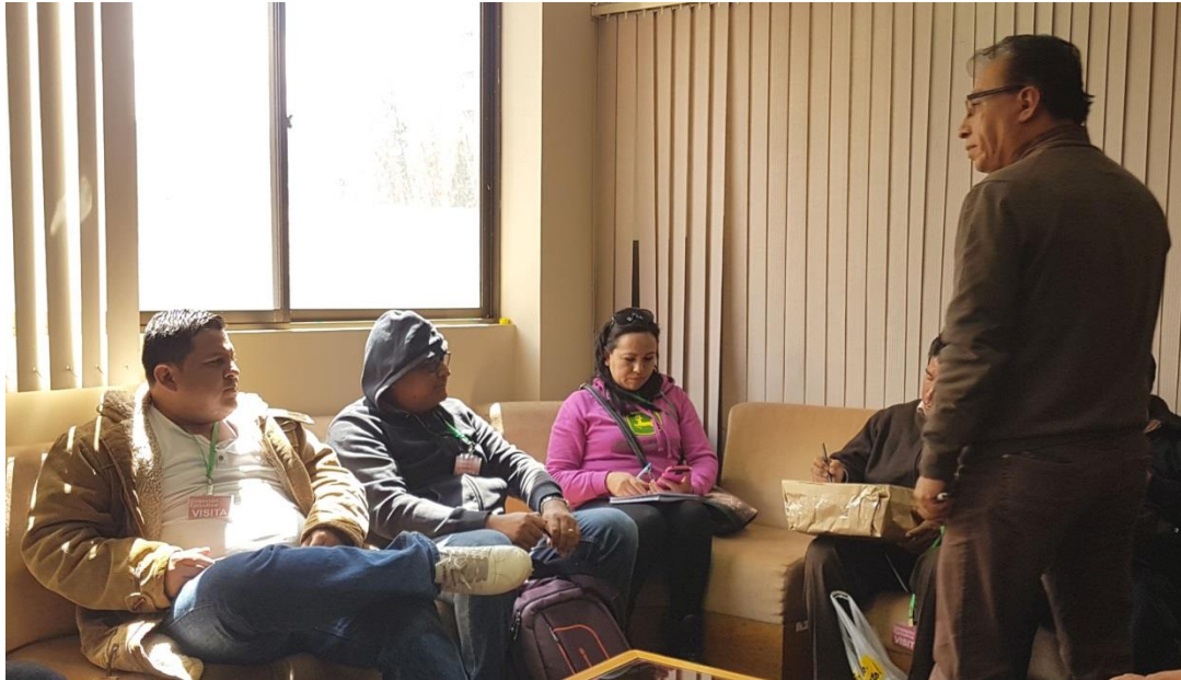
FOTO 3 - REPRESENTANTES DE EMPRESAS INTERESADAS

"...avanzamos en el proceso que nos permitirá la construcción de estas nuevas viviendas en Guayaramerin, dentro de los plazos establecidos y para suerte nuestra todos los interesados, en esta fase, presentaron los requisitos a cabalidad", señaló.