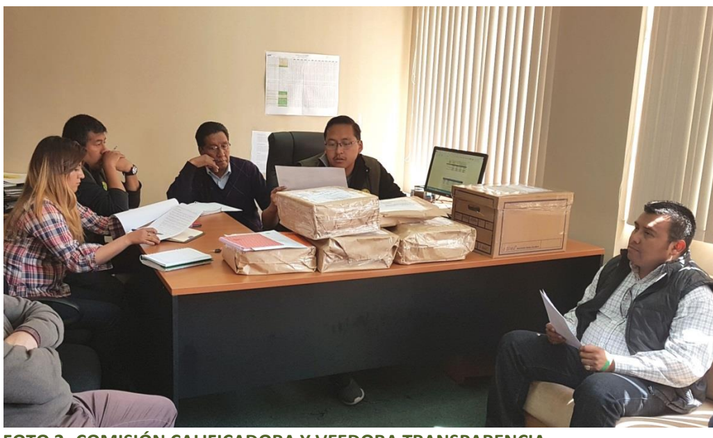
FOTO 2- COMISIÓN CALIFICADORA Y VEEDORA TRANSPARENCIA