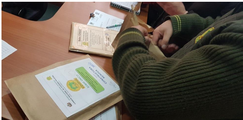
FOTO 2 - Apertura de sobres

Dando cumplimiento a la Normativa del Sistema de Administración de Bienes y Servicios, el Consejo Nacional de Vivienda Policial (COVIPOL) y las empresas interesadas en la supervisión técnica para la construcción de 30 viviendas de