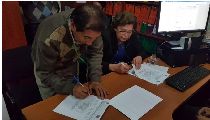
Foto 3 - Firma de acta

Indicó que las empresas constructoras que presentaron sus propuestas de interés son: Trino S.R.L., Empresa Unipersonal Voyager, Constructora Renova, Empresa Constructora Sotopeña S.R.L. y Empresa Unipersonal Fararq, quienes cumplen, en esta primera etapa, con todos los requisitos.