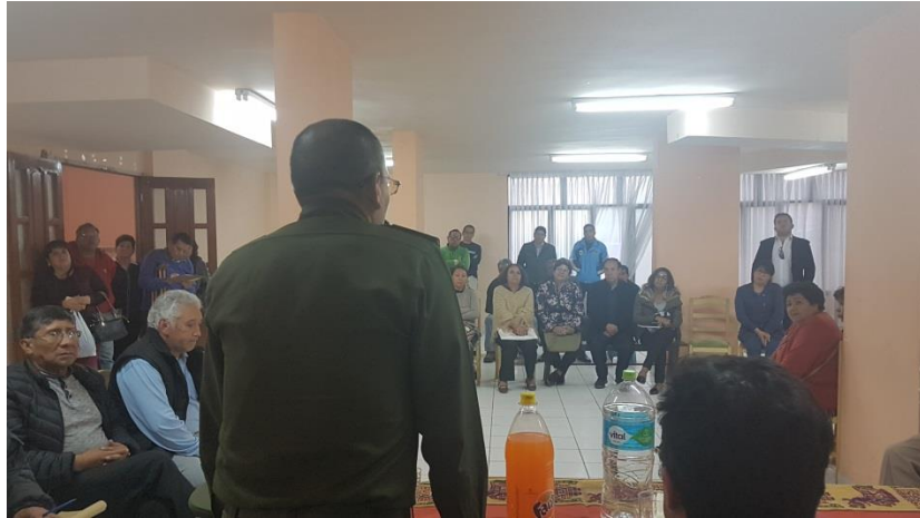
FOTO 3 INTERVENCIÓN DIRECTOR EJECUTIVO COVIPOL

“Hoy nos reunimos para acordar la aprobación de los planos y remitirlos al Gobierno Municipal de La Paz, para que ellos realizan las inspecciones correspondientes en cada departamentos y entregar nuestra documentación como propietarios”, señaló.