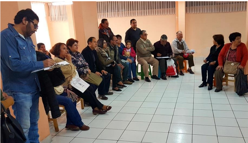
FOTO 2. PROPIETARIOS DEPARTAMENTOS CONDOMINIO MIRAFLORES

De acuerdo a la notificación entregada a todos los propietarios de los departamentos correspondientes al Condominio Miraflores, en la ciudad de La Paz, este viernes, se realizó la reunión de coordinación para definir la modalidad técnica de aprobación de los planos de fraccionamiento.