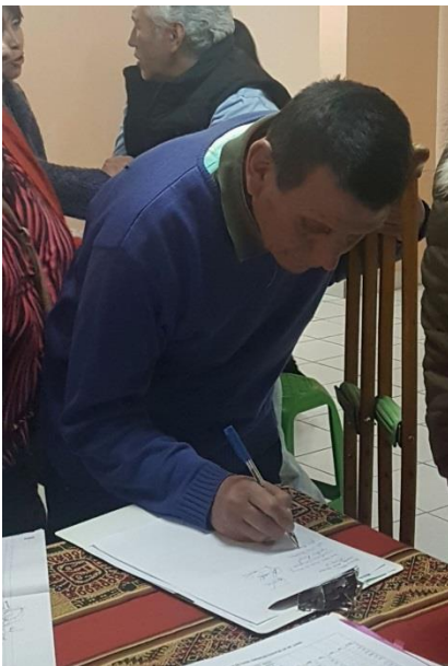
FOTO4. FIRMA DE ACTA