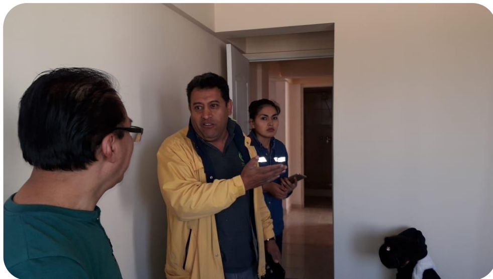
REUNIÓN CON RESPONSABLES DE LA OBRA

“El proyecto está casi concluido, hoy advertimos la falta de enmasillado en algunos pequeños sectores y retoques en la pintura, que serán subsanados en los próximos días antes de la entrega definitiva”, manifestó.