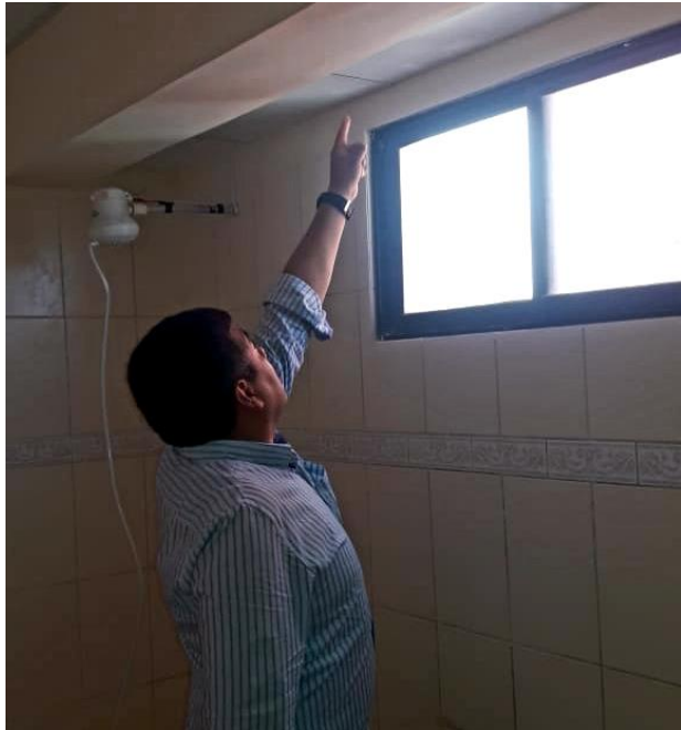
FOTO 1. INSPECCIÓN PREDIOS